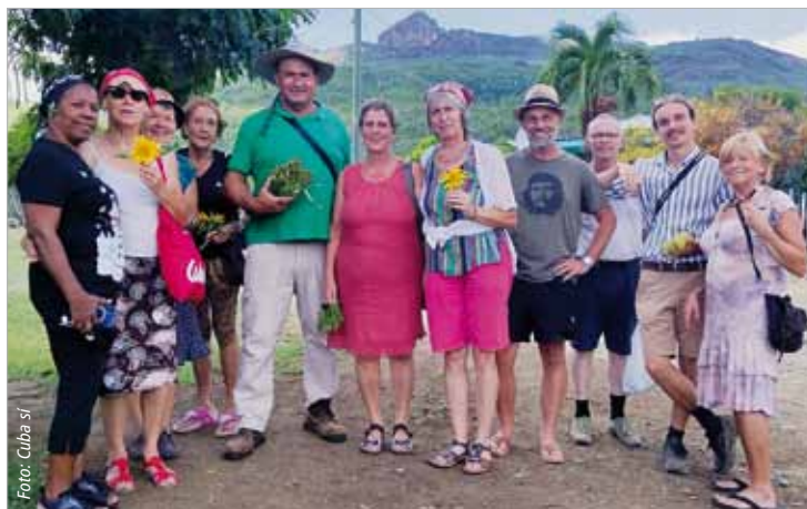
Auf den Selbstversorgungsflächen der Beschäftigten der Genossenschaft „Eliomar Noa“ in Imías.

Unsere Reise wurde durch Solidaritätsbesuche im Provinzkrankenhaus „Agostinho Neto“ in Guantánamo und in der Poliklinik in der Gemeinde Felicidad abgerundet. Die unmenschliche Blockade-Politik der USA gegen Kuba