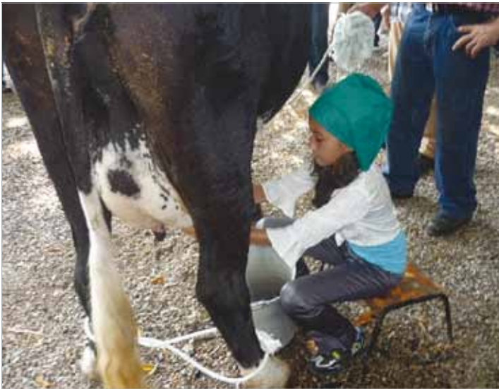
Bei Wettbewerben stellen die Kinder ihr Können unter Beweis.

Übereinstimmung mit den Vorgaben des Nationalen Plans zur Ernährungssouveränität und Ernährungsbildung (PlanSan) vermittelt ACPA zudem in Schulungen der jungen Generation, wie unbelastete Lebensmittel aus ökologischer Produktion zu fairen Preisen vom Erzeuger zum Verbraucher gelangen und wie sich eine bewusste Ernährung positiv auf die Gesundheit auswirkt.