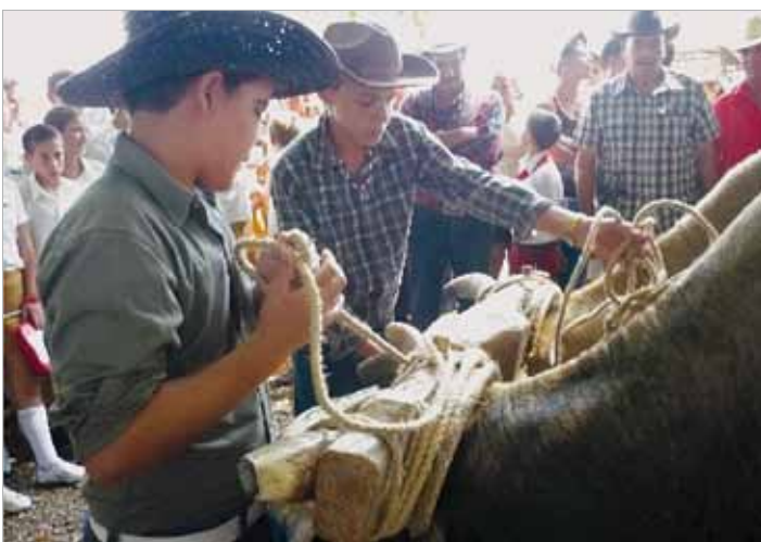
Jungen beim Erlernen traditioneller viehzüchterischer Fertigkeiten.

Mittels Rodeo-Wettbewerben und sportlicher Aktivitäten fördert ACPA die Bewahrung viehzüchterischer Traditionen und das Interesse bei Kindern für eine spätere berufliche